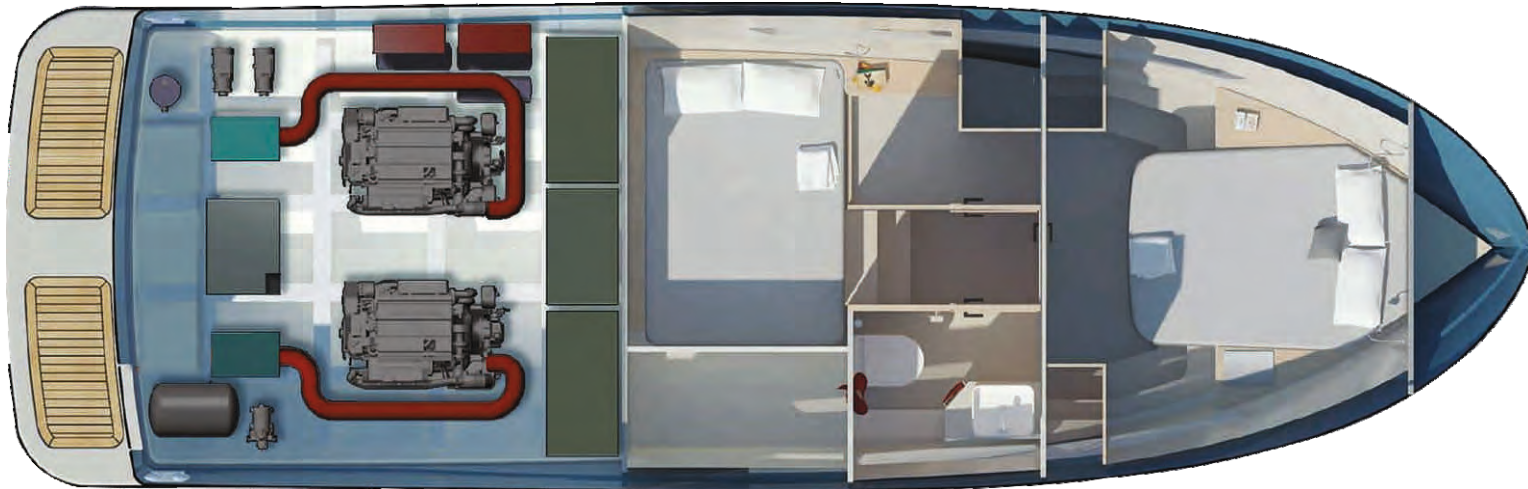
Lower Deck 2 engines - VP D6 IPS400